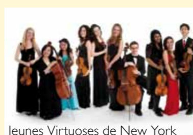
Jeunes Virtuoses de New York

Cœuvres de Dvorak, Sarasate et Tchaïkovsky