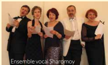
Ensemble vocal Sharomov

L'Ensemble vocal Sharomov chante dans le monde entier, un répertoire très large, qui va de la musique religieuse russe au Gospel et Negro spiritual américain, en passant par le répertoire classique. Les Fêtes Musicales invitent régulièrement cet excellent groupe de Sibérie.