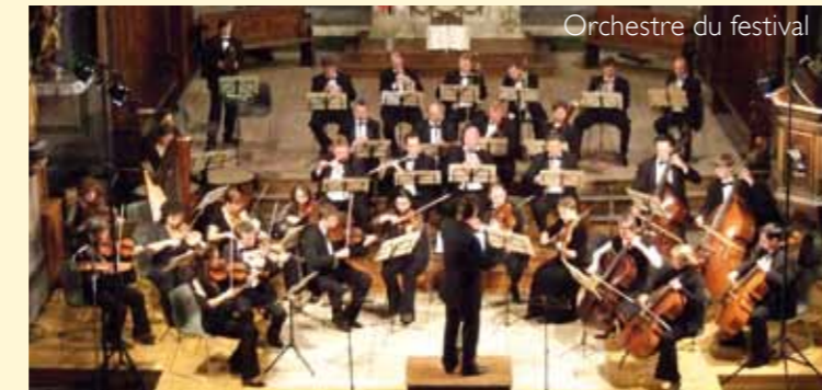
Orchestre du festival

Concert – Tarif : 16 € – 12 € réduit – 6 € jeunes