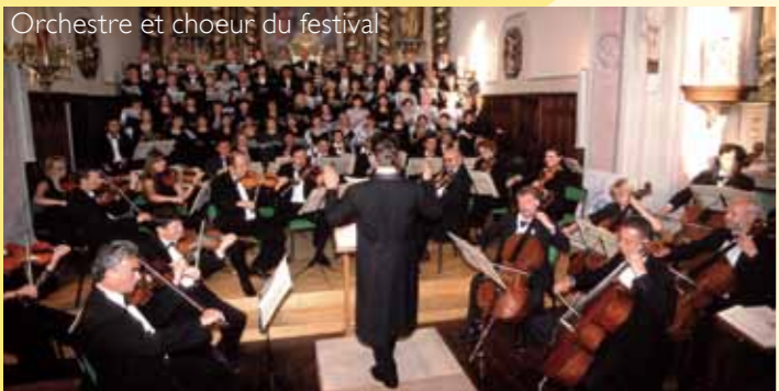
Orchestre et choeur du festival

Concert – Tarif : 16 € – 12 € réduit – 6 € jeunes